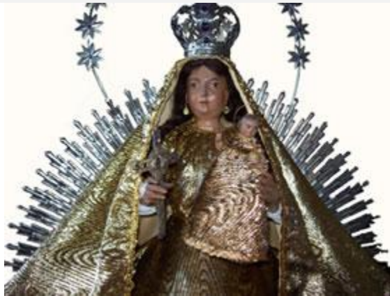
Imagen de Ntra. Sra. de La Caridad venerada en la iglesia de Sto. Tomás (Santiago de Cuba), desde la primera mitad del siglo XVIII.

Era 20 de mayo de 1951. La imagen de Ntra. Sra. de La Caridad, venerada en la antigua y santiaguera iglesia de Santo Tomás, fue llevada a El Cobre. Y allí La