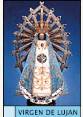
VIRGEN DE LUJAN